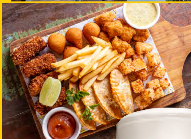
TÁBUA DE BESTEIRINHAS