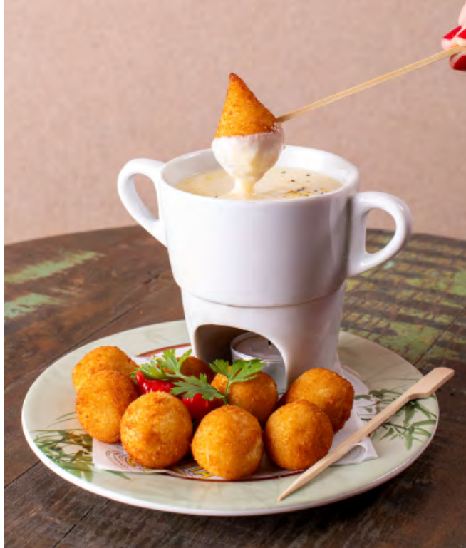
COXINHAS D. JÚLIA 2.0