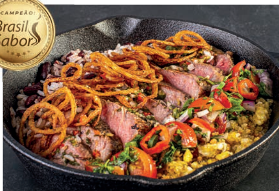
PF DO BANANA 400g 89 Bife ancho com cebola crocante, mexido de arroz com feijão, farofa crocante, vinagrete e batatas crocantes