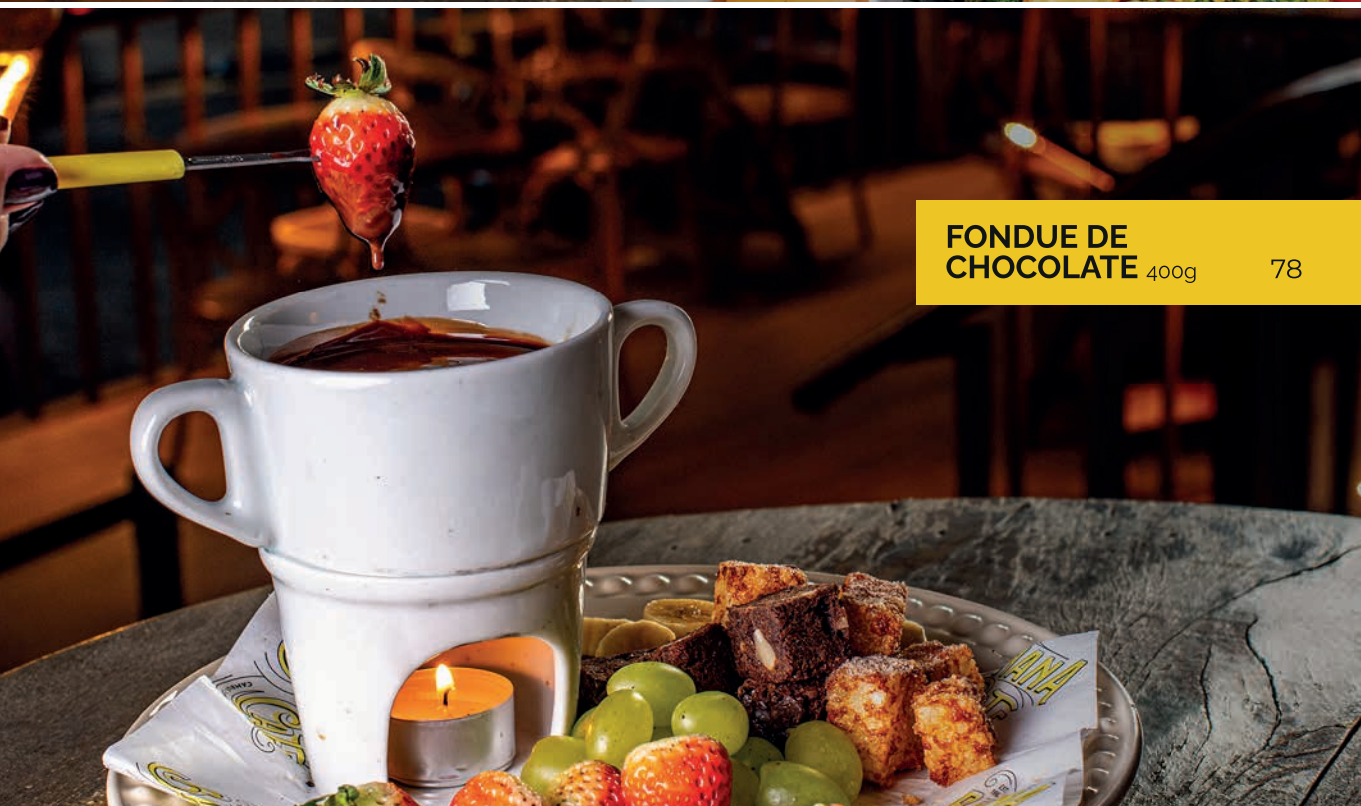
FONDUE DE CHOCOLATE 400g