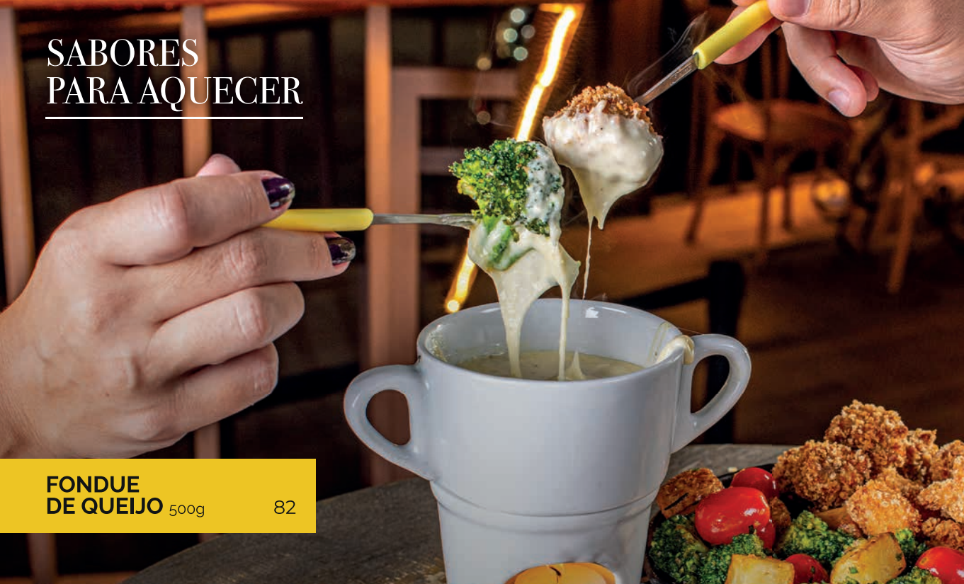
FONDUE DE QUEIJO 500g