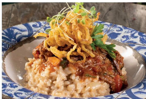
RAGU DE CUPIM 350g 82 Cupim desmanchante com risoto de cebola caramelizada e crocante de cebola