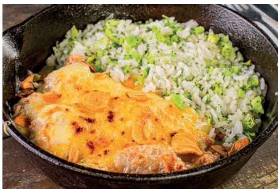
FILE GRATINADO 400g 82 Cubos de filé mignon crocantes e gratinados com Catupiry, arroz com brócolis e alho frito