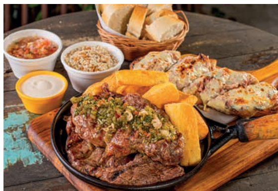
TÁBUA DO BANANA 2 pessoas – 800g 160 LINGUIÇA MINEIRA 190 ANCHO 220 FILE MIGNON