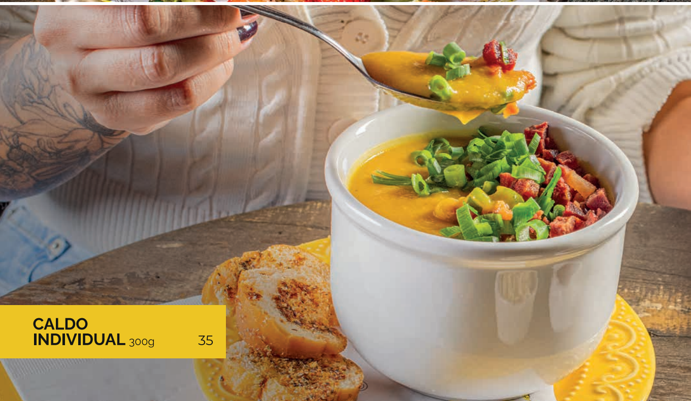
CALDO INDIVIDUAL 300g