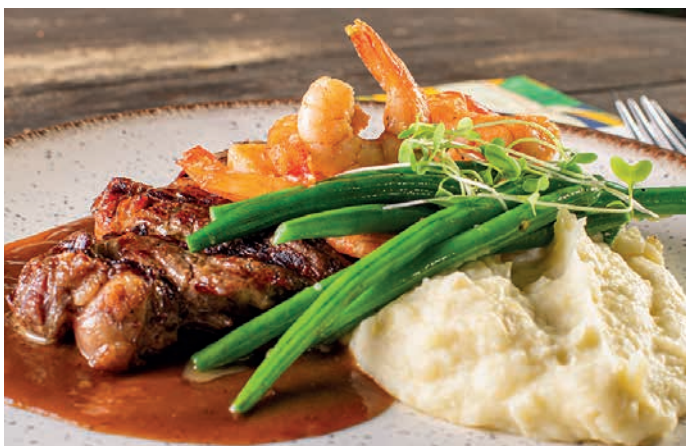
ENTRECÔTE 400g 128 Delicioso entrecôte com camarões grelhados, purê de batatas, molho roti e vagem